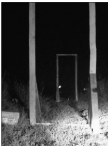
Fotografie a kresby rondelov z rozličných zdrojov na internete Rondel z Komjatíc