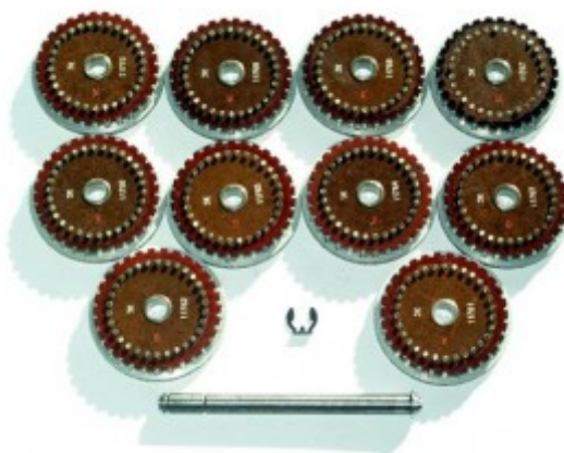
Obr. 2. Sada rotorov Fialky