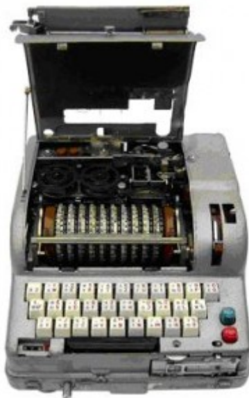
Obr. 1. Pohľad na Fialku M-125

V strede pod krytom sa nachádza kódovacie zariadenie obsahujúce 10 rotorov. Rotory sa pohybujú pri každom stlačení klávesy. Sú pripojené z ľava na tzv. reflektor a z prava na vstupný disk.