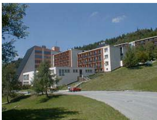
Hotel Dlouhé Stráně

WITNESS je přední software pro simulaci a optimalizaci výrobních, obslužných a logistických systémů britské společnosti Lanner Group Ltd. Prediktivní technologie a simulační metody poutají stále více pozornosti odborníků v mnoha oblastech. Zachování konkurenční schopnosti a zvyšování úrovně poskytovaných služeb vyžaduje od organizací neustálé změny. V podmínkách přísného sledování nákladů je potřebné ověřovat možnosti plánovaných systémů a nacházet inovativní a úspěšná řešení.